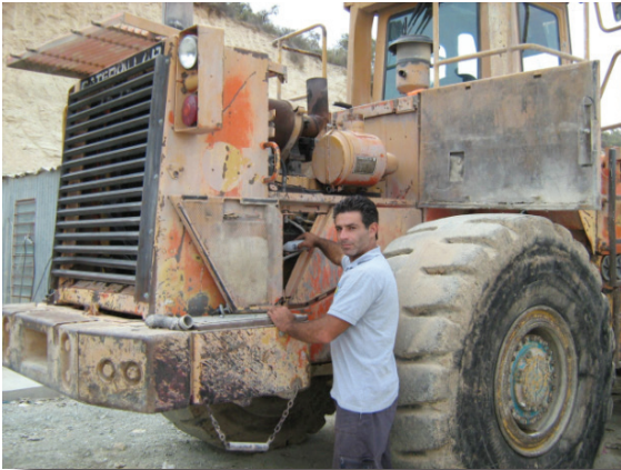
O mecânico adiciona PowerShot® 10 ao óleo do motor.